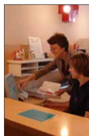
Beratung für Kollegen aus neues Aufgaben-gebiet, 2007