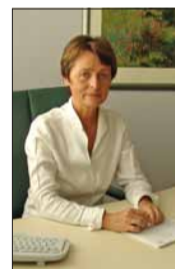
„... und alle Kassen“