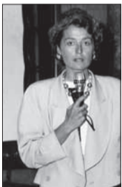
Referat beim Internationalen Osteoporose-Kongress, 1992