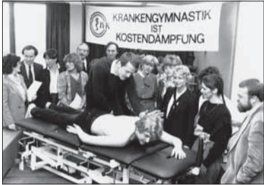
1. IFK-Kongress in Düsseldorf im Zeichen der Kostendämpfungsgesetze