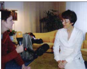
Das ZDF zu Gast: Gespräch über Zwei-Klassen-Medizin, 2005