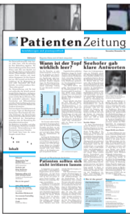
Die erste Patienten-Zeitung, 1999