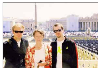
„Privat“ (mit ihren Söhnen)