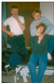
Fortbildung in Manueller Therapie, 1985