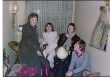
Das erste Team