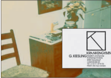
Das erste Wartezimmer und die erste Visitenkarte