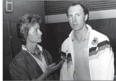
Interview mit Franz Beckenbauer, Teamchef des DFB, zur Berufung des ersten Krankengymnasten Klaus Eder in das medizinische Team vor der Fußball-Europameisterschaft 1988 in Deutschland