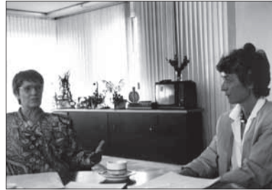
Gespräch im Bundesgesundheitsministerium über die Inhalte des neuen Berufsgesetzes für Physiotherapie mit der zuständigen Ministerin Prof. Rita Süßmuth